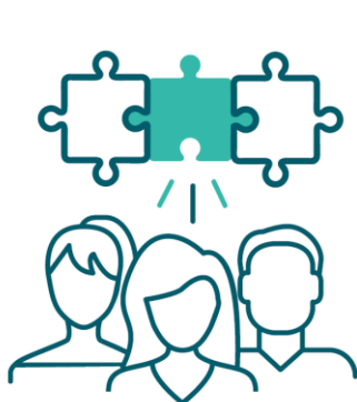
Sammen ser vi etter de beste løsninger

Vår helhetlige arbeidsmodell i prosjektet som vi arbeider med gjennom medarbeiderdrevet innovasjon og sammen med partene i arbeidslivet;